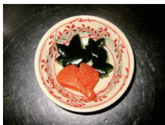
秋の行事食 型抜ゼリー

だし汁と煮汁で味を調え、凝固剤を入れて加熱し冷やすとゼリー状に固まります。また二種類の野菜をだし汁と共に加熱し、別々にカッターにかけ二層のゼリーに固め、とろみ付のたれをかけるなど、見た目も味もよくなるように工夫しています。カッターにかけにくいような食材は似たような栄養価やでき上がりになるように考えて献立作成をしています。