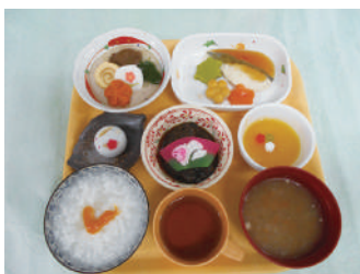
みじん切形態(おせち)