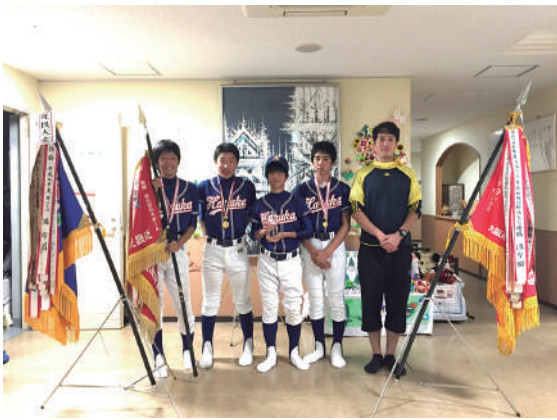
大会優勝旗(左から北摂・大阪府・近畿)とともに

野球部に入部して六年、最初はボールに触れたこともなく、前に投げることもすらできませんでした。そんな状態でも五年間練習を続け、見事十四年ぶりに三連覇することができました。初めてボールに触った日から六年目の引退がかかった試合に、一度も負けなかったことです。(中三 男子)