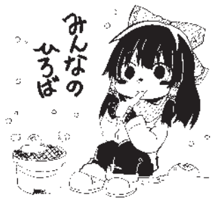
カット絵・小六 まり