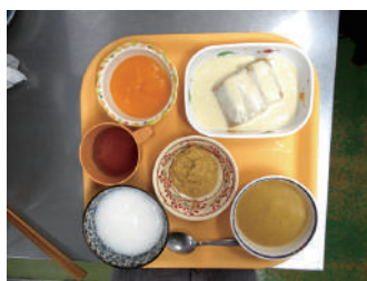
煮魚ゼリーのミキサー食