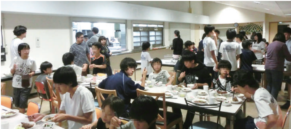
総合児童棟4階の遙学園大食堂