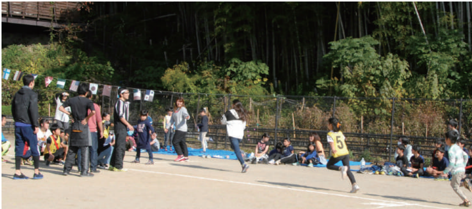
2019年遙学園・ひびきスポーツフェスティバル 各ホーム・職員対抗リレー