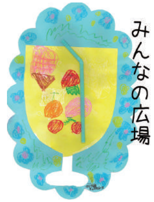
カット絵・五歳 男子