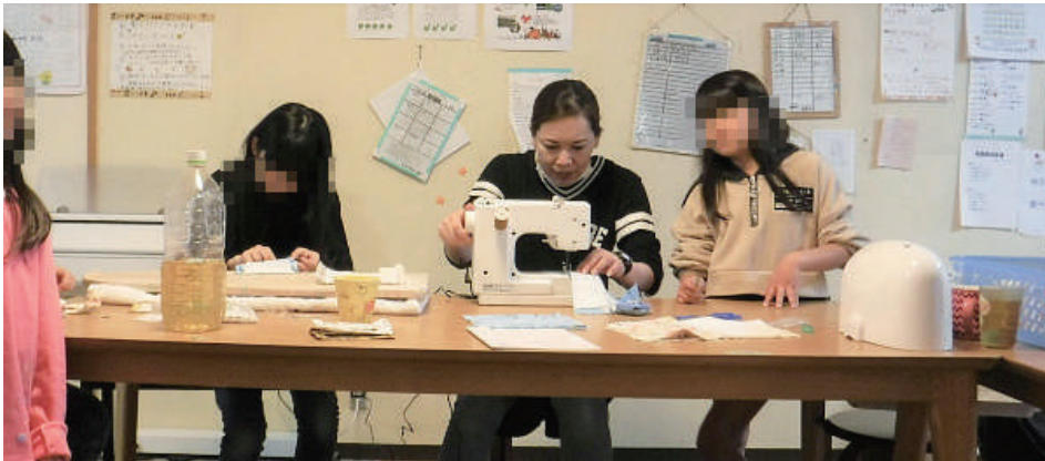
ひびき女子ホーム・手作りマスク作成中