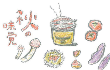
カット絵・高三 男子